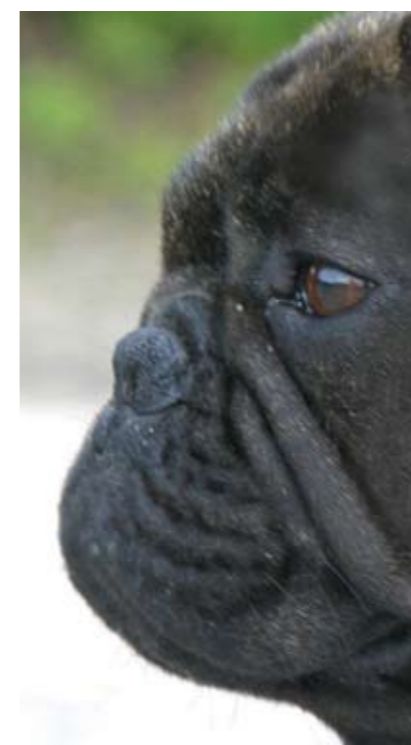
Hvis en hund slet ingen næseryg har, så er der ikke plads til ganesejlet inde i mundhulen og vejtrækningen besværes.